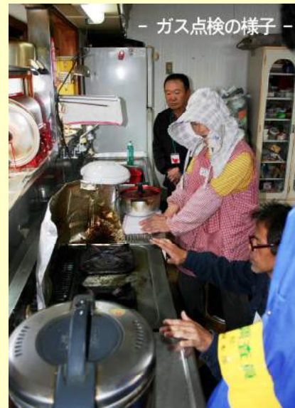
- ガス点検の様子 -

当会では各団体と協力し、毎年ひとり暮らしの高齢者住宅安全点検活動を行っています。この事業は水道・電気・ガスに関する企業のボランティア活動として、高齢者の安全のために民生委員の協力を得ながら活動しています。今年度は水道を6月4日に電気