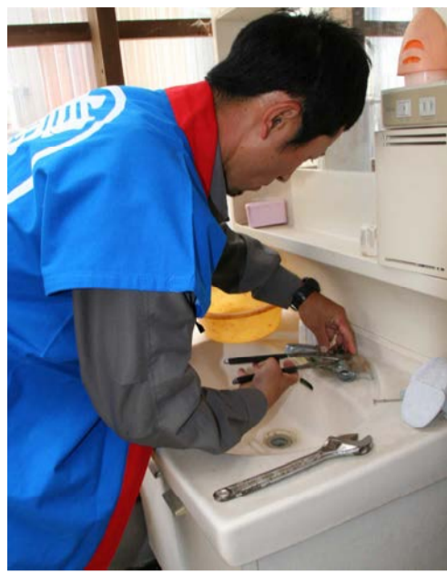
工具使って蛇口を調整するスタッフ

6月7日(土)、約40世帯のひとりぐらし高齢者住宅の水道施設無料点検を行いました。 この事業は、水道週間の時期に合わせて、島原市水道課、島原市給水工事指定店組合、島原市民生委員児童委員協議会連合会、島原市社会福祉協議会が連携し毎年行っています。 民生委員さんの案内で、点検を希望したひとりぐらし高齢者住宅を訪問し、水道器具や漏水の点検を行い、必要な場合は、パッキンの取替や蛇口の調整などを無料で行いました。