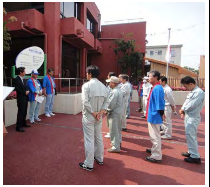
出発式に参加する点検スタッフ

行いました。当日は、午前9時30分から市福祉センターで出発式を行い、点検スタッフが5班に分かれ各地区の民生委員宅へ向かいました。民生委員と合流した点検スタッフは、ひとりぐらし高齢者宅を訪問し、合計49世帯の点検を行い高齢者から喜ばれました。