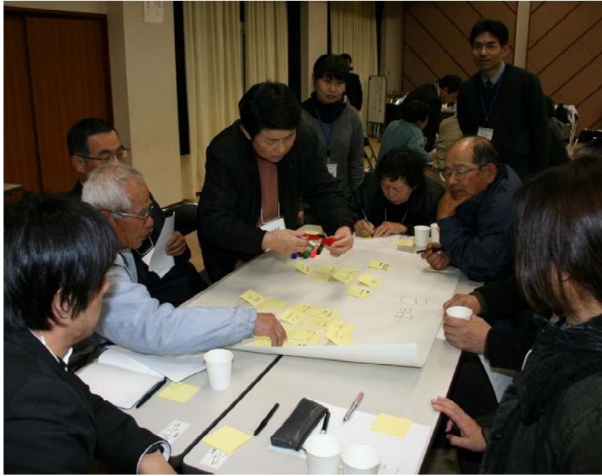
活発に進むグループ活動のようす

た第1回目の懇談会でしたが、第2回目の懇談会では第1回目に出された課題に対して、行政の役割はどこまでか、福祉事業者や住民は何ができるのか、といったことについて懇談してもらうことになりました。 各地区2回の地区懇談会で話し合った結果は、「地域福祉(活動)計画」に反映されることとなります。