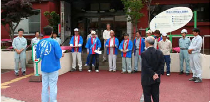
出発式 II市福祉センター