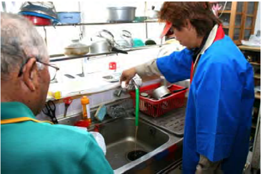
部品を交換する 点検スタッフ